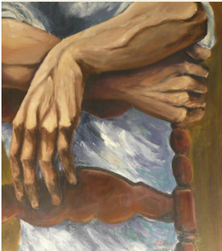
Danilo Ganassin - zonder titel