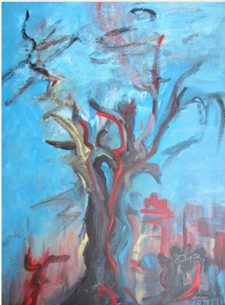
'On Air', Santina Chirulli, 2013, acryl op papier, elk werk: 20 x 40 cm