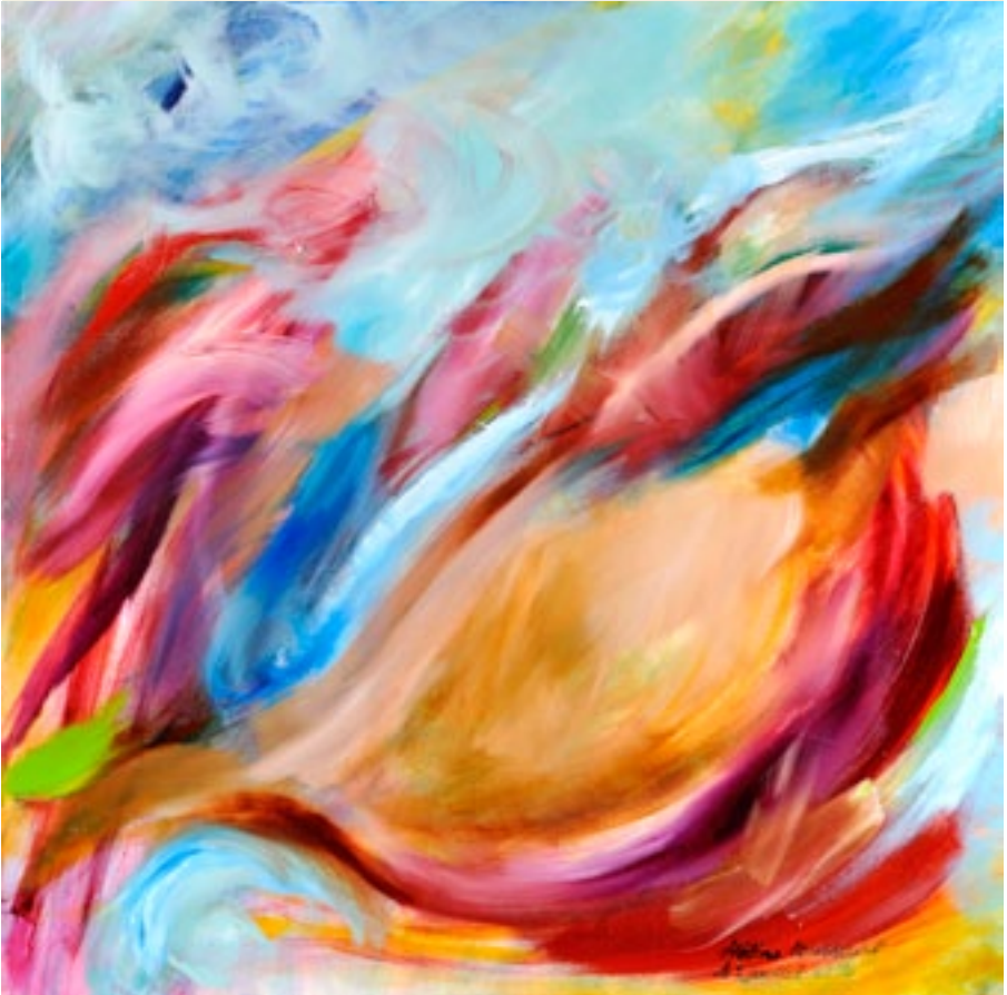
Hélène Toussaint - zonder titel Acryl op doek - 100x100 cm