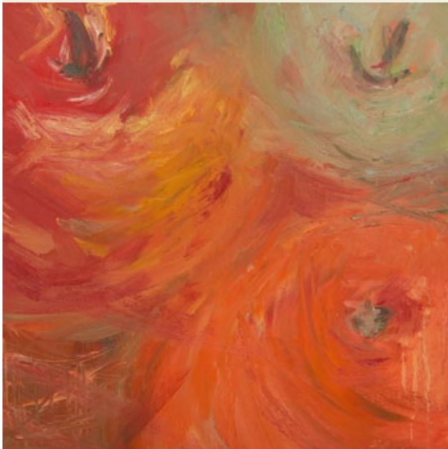
'Different Directions', Santina Chirulli, 2006, olieverf op doek, 50x50 cm