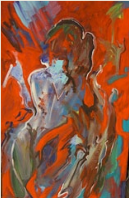
'L'età dell'innocenza' Santina Chirulli, 2012, acryl op doek, 60 x 120 cm