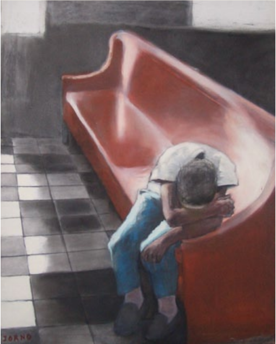
Cecile Jorno - zonder titel Gemengde techniek op doek - 80x120 cm