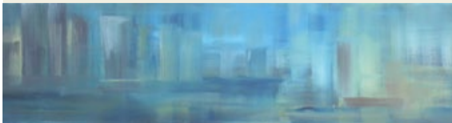
'Ancora Ricordi, Chicago Skyline', Santina Chirulli, 2013, olieverf op doek, 80x20 cm