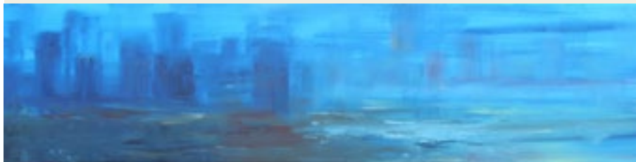
'Ricordi, Chicago Skyline', Santina Chirulli, 2013, olieverf op doek, 80x20 cm