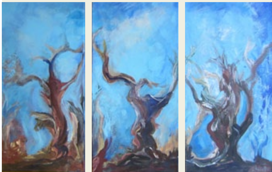
'La magia dell'unione' (drieluik), Santina Chirulli, 2012, acryl op doek, elk werk: 20x40 cm