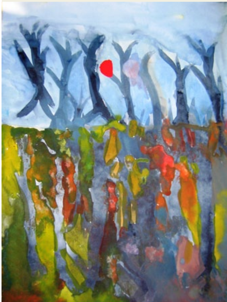
José Doncel - zonder titel Aquarel op papier - 30x40 cm