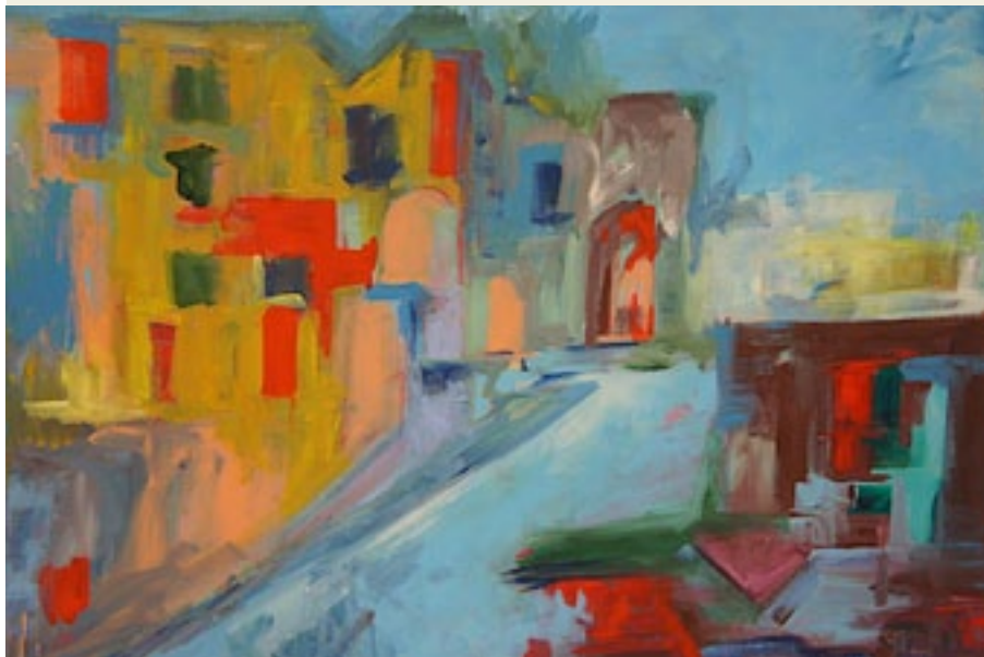
'City', Santina Chirulli, 2012, acryl op doek, 80x60 cm