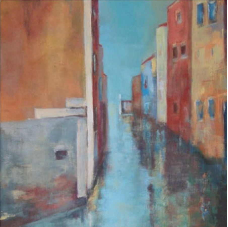
Jepee - 'Pont et Canal' olieverf op doek - 40x40 cm