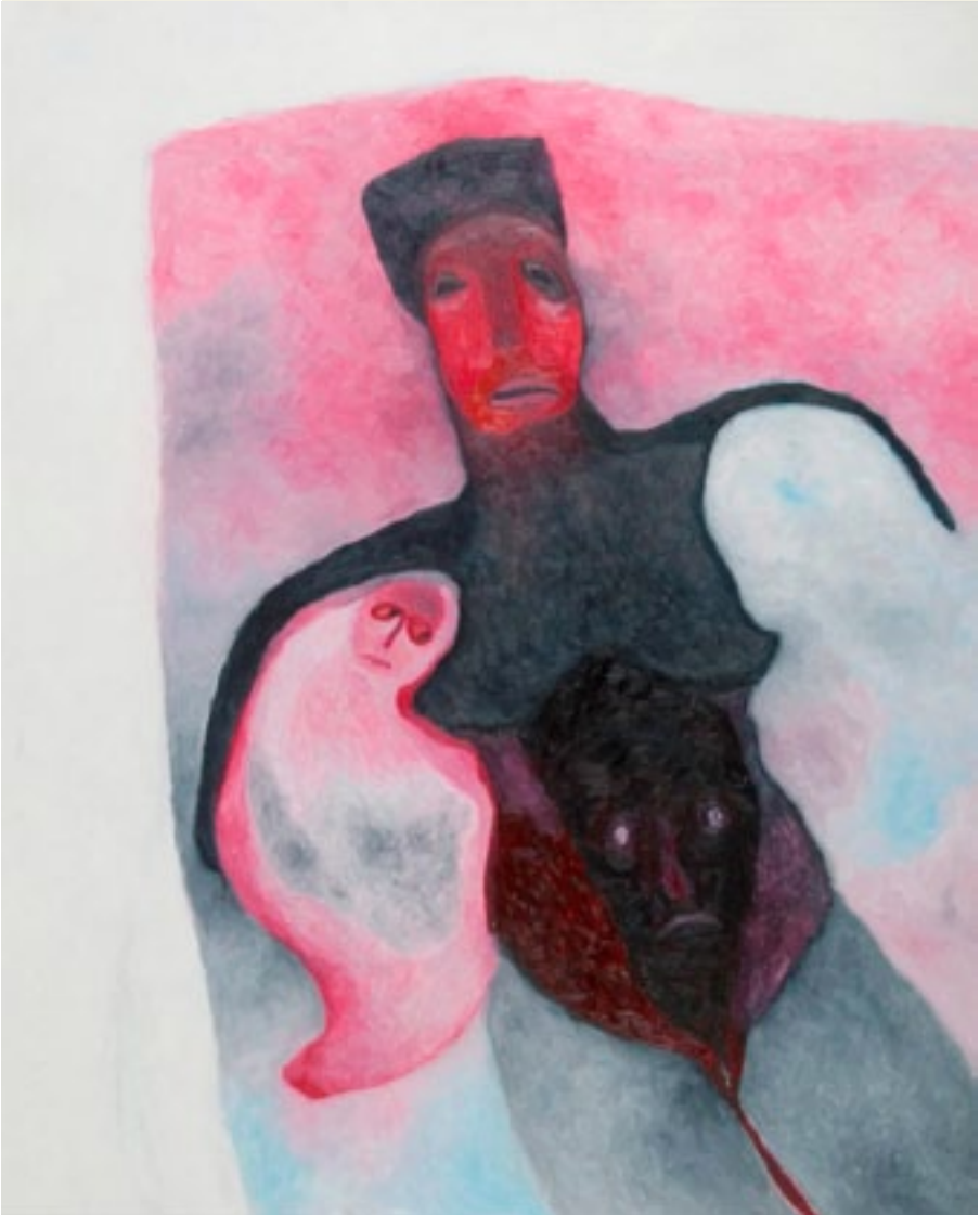
Cathérine Crepin - zonder titel olieverf op doek - 70x100 cm